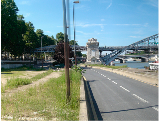
Aménagement du Quai d'Austerlitz à Paris, (75) PHOTOS AVANT/APRES