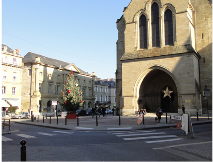
Les abords de la Collégiale de Brive-la-Gaillarde (19) ) PHOTOS AVANT/APRES